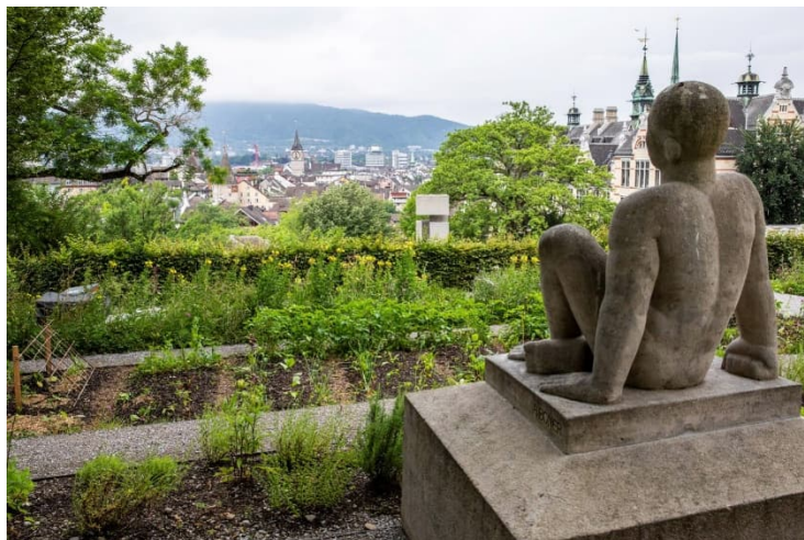
Ausblick vom Schülergarten Bodmerhuus

Wir möchten uns herzlichst für die Spenden und Beiträge bedanken.